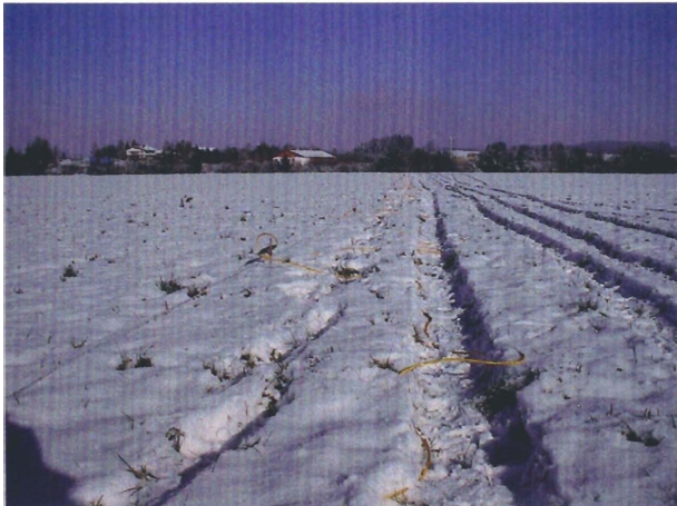
Foto 3 : Auslage der Kabel ( Profil neu; Blick von Süd nach Nord )